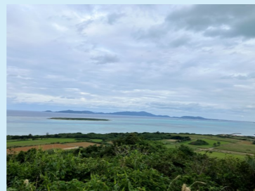
写真左: 小浜島の景色 写真右: 小浜診療所スタッフ