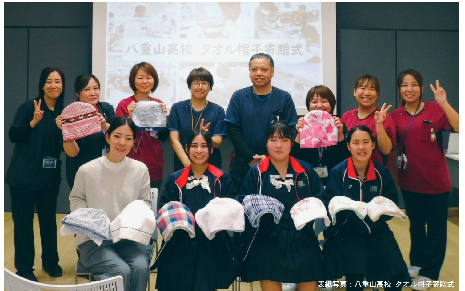
表紙写真: 八重山高校 タオル帽子寄贈式